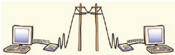
Εικόνα 4.6. Σύνδεση δύο υπολογιστών μέσω σταθερής τηλεφωνίας