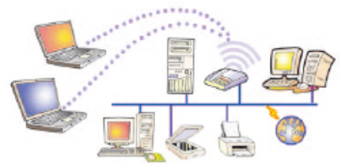
Εικόνα 4.2. Το δίκτυο του σχολικού εργαστηρίου

«δίκτυο υπολογιστών» εννοούμε ένα σύνολο από δύο ή περισσότερους υπολογιστές που είναι συνδεδεμένοι μεταξύ τους, ώστε να μπορούν να ανταλλάσσουν δεδομένα και να μοιράζονται διάφορες συσκευές (εκτυπωτές, σαρωτές, σκληρούς δίσκους).