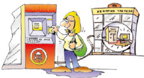
Εικόνα 4.7. Πίσω από ένα ΑΤΜ κρύβεται ένας Η/Υ που συνδέεται με το δίκτυο των Η/Υ της Τράπεζας

Τα δίκτυα των υπολογιστών έχουν μεγάλη εφαρμογή στις καθημερινές μας δραστηριότητες (π.χ. τραπεζικές συναλλαγές, έκδοση αεροπορικών ή ακτοπλοϊκών εισιτηρίων, κρατήσεις ξενοδοχείων ή θεάτρων, αυτοματοποίηση διαφόρων δημόσιων υπηρεσιών) καθώς μας διευκολύνουν, ώστε μέσα σε πολύ λίγο χρόνο να διεκπεραιώνουμε τις εργασίες μας. Αν θέλουμε, για παράδειγμα, να πάρουμε χρήματα από μία Τράπεζα, χρησιμοποιούμε μια Αυτόματη Ταμειολογιστική Μηχανή (ΑΤΜ) που είναι συνδεδεμένη με το δίκτυο υπολογιστών της τράπεζας (Εικόνα 4.7).